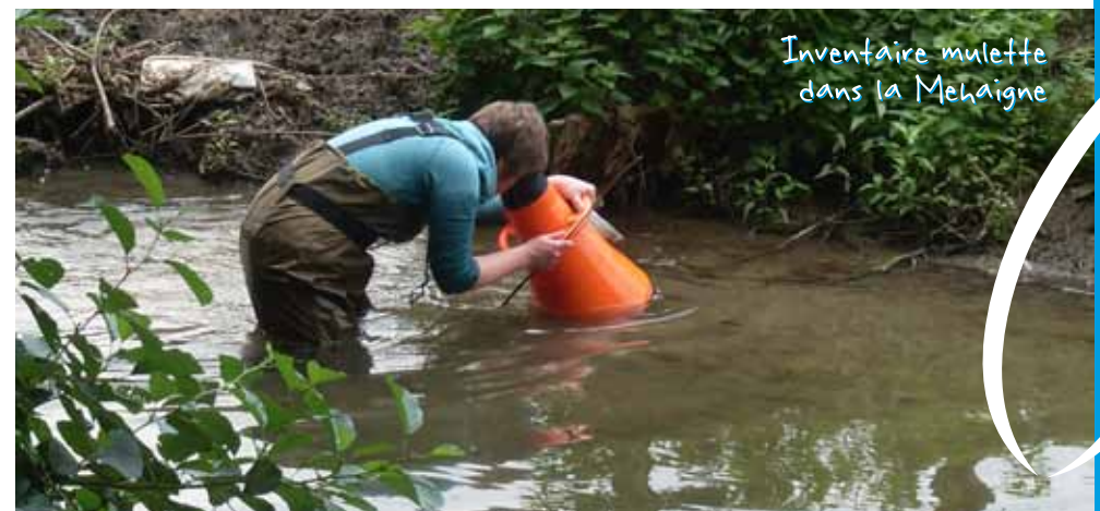
Inventaire mulette dans la Mehaigne