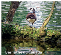
Bernache du Canada